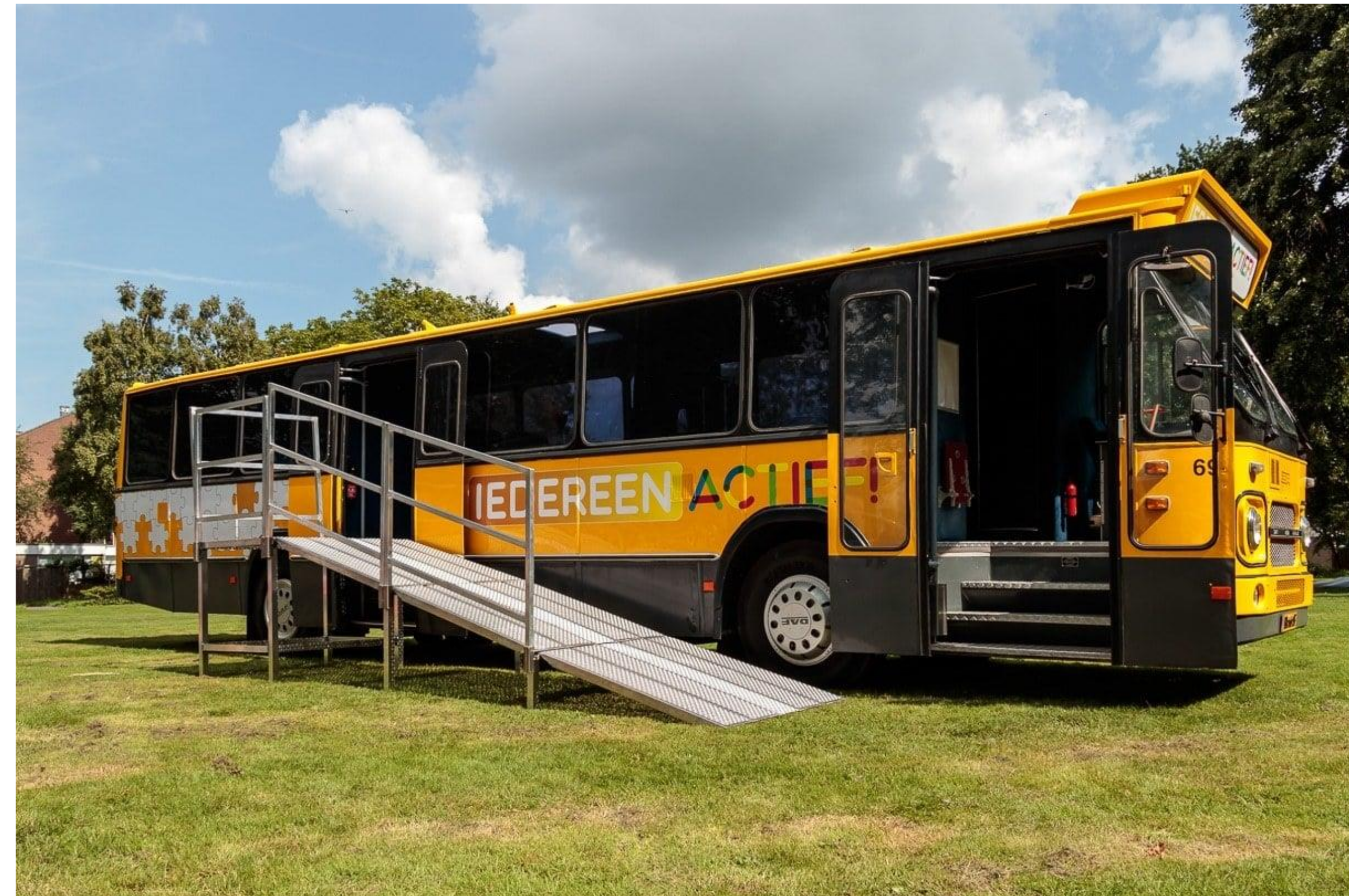
Figuur 2: Sportcarrousel